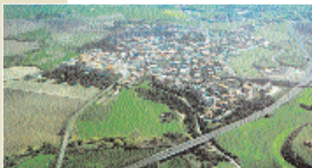
Montalto di Castro.

Naturalmente queste mete sono anche raggiungibili indipendentemente l'una dall'altra.