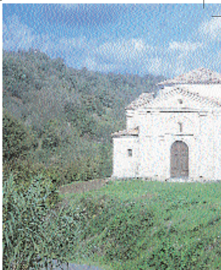
La chiesetta di Sant'Egidio

A 344 metri di altitudine, Cellere si presenta come il tipico abitato di sperone, allungato su uno stretto cuneo tufaceo compreso tra due fossi, al cui termine, al di là di una porta, sorge il borgo medievale con il castello dei Farnese, trasformato ora in casa di abitazione. Percorsa quindi tutta la parte nuova del paese, di recente costruzione, si entra nella "via maestra" del centro storico (tratto dell'attuale via Cavour) che si estende dalla "porta Pubblica" sormontata da torre - detta anche nel '700 "porta di Castel Dentro" - fino alla stradina del borgo denominata "Fiorenzuola". Una bella fontana, con delfini e gigli farnesiani, rallegra la piazzetta della "Appianata", mentre lungo tutto la strada si incontrano scorci panoramici continui fra archi, sottopassaggi, vicoli di impianto medievale. La storia di Cellere può essere do-