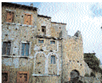
Il palazzo Ducale.

La chiesa di San Rocco, le cui origini ci rimangono ignote, è in