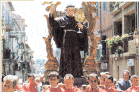
Un momento della processione di San Bernardino.