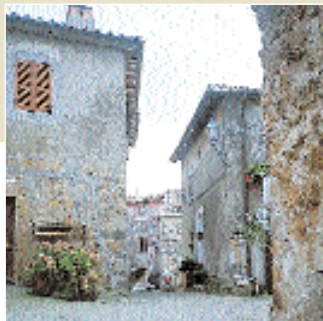
Il borgo di Pianiano.

tima settimana di agosto o seconda di settembre. Manifestazioni gastronomiche con cena medievale nella frazione di Pianiano. In occasione di questa festa nell'anno 2000, il paese si è mobilitato per l'inserimento fra i Guinness dei primati per la bruschetta più lunga d'Italia (300 metri!).