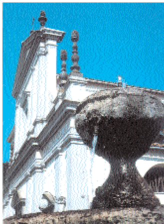
La fontana e la Collegiata in piazza De Andreis.

za De Andreis prospetta la collegiata dedicata ai Santi Andrea e Giovanni Battista , della fine del secolo XVIII: a tre navate a croce latina, presenta sulla facciata tre portali in pietra adornati con sei fiaccole anch'esse in pietra. All'interno, a destra del presbiterio, è la neoclassica cappella Bonaparte , dove è collocata la tomba di Luciano adorna di un bassorilievo attribuito al Canova, con diversi, interessanti gruppi scultorei. Pregevoli i numerosi dipinti, fra i quali Adorazione del Bambino (secolo XV), Profeti (scuola toscana del XVI secolo), Ss. Andrea e Giovanni Evangelista (Domenico Corvi 1791); inoltre: Crocifisso ligneo della prima metà del secolo XIV; fonte battesimale rinascimentale, bassorilievo del '500 (Regina Pacis).