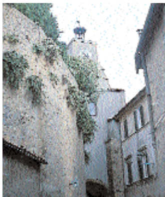
La Rocca addossata alle abitazioni.

di scuola senese. Ai lati del coro si presentano quattro grandi quadri raffiguranti gli evangelisti, dipinti da "Moises Secundus" a.D. 1741. Interessanti le grandi pale dipinte poste sulla facciata interna, con scene del battesimo, del martirio e della gloria di Sant'Ermete. Oltre al quadro della Madonna del Giglio, patrona del paese posta nella cappella del Sacramento, una tela del pittore L. Coghetti realizzata verso la metà del XIX secolo, si evidenziano per valore artistico e storico i due amboni di marmo del IX secolo, provenienti dal distrutto Duomo di San Savino di Castro.