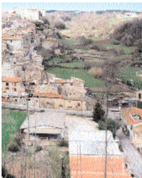
circondato da prati verdi.

classica; contiene quattro tele di notevole interesse.