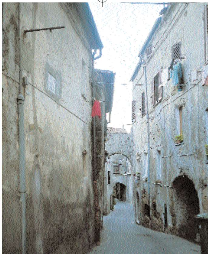
Una stradina di Ischia di Castro dal tipico impianto medievale.