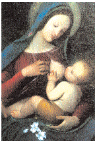
La Madonna del Giglio, dipinto su tela del Coggetti, secolo XIX.

corrisponde al piccolo vano che racchiude l'affresco con la sacra immagine della Vergine, risalente agli inizi del '400, e alla cappella interna con volta a crociera, nella cui parete di fondo è raffigurata