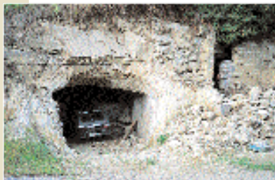
Cantina scavata nel tufo.

All'ingresso del paese già si vedono le indicazioni per la strada che conduce al parco del Timone dove si trovano le acque di questo affluente del fiume Fiora in un bosco di alte querce. Proseguendo oltre, valicato un pendio tra boschi e uliveti, si arriva a Pianiano , caratteristico, incantevole villaggio agricolo medievale, ben conservato, con la chiesa di San Sigismondo.