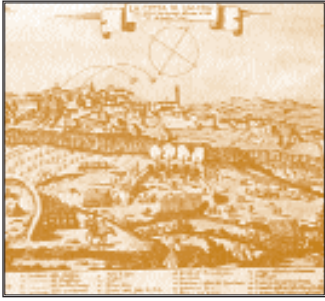
Stampa della città di Castro del secolo XVII.

de al borgo medievale ; proseguendo dritti si giunge a una piazzetta su cui prospetta la mosaiata facciata barocca della parrocchiale di Sant'Ermete .