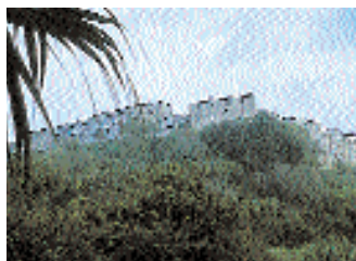
Farnese, visto dalla chiesa di Sant'Anna.

nese. Nella chiesa di questo convento sono sepolti molti personaggi della famiglia Farnese. Attualmente esso è occupato dalle suore mercedarie, che gestiscono una casa di riposo per anziani. Quello che invece era conosciuto come convento di San Rocco al