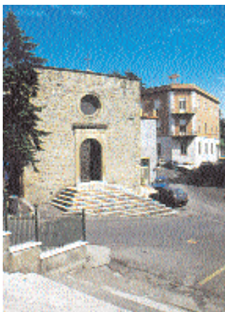
La chiesina di San Rocco, recentemente restaurata.

una delle più antiche residenze di casa Farnese, si presenta oggi nella forma datale dalla ricostruzione cinquecentesca, purtroppo incompiuta, attribuibile ad Antonio da Sangallo il Giovane, archi-