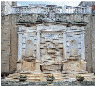
La fontana di inaugurazione dell'acquedotto.

Subito appresso, in piazza Regina Margherita 129, è la parrocchiale di San Salvatore , dalla facciata rifatta nel 1954. Il campanile venne realizzato nel 1711. All'interno, della vecchia chiesa romanica, si conservano due bassorilievi raf-