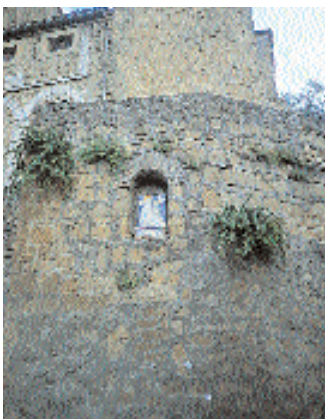
Tratto di mura della Rocca, con una piccola nicchia votiva.

Il Duomo , dedicato a Sant'Ermete , ha subito nel corso dei secoli, diverse trasformazioni. La forma attuale dell'impianto architettonico, opera dell'architetto Prada di Viterbo, risale alla seconda metà