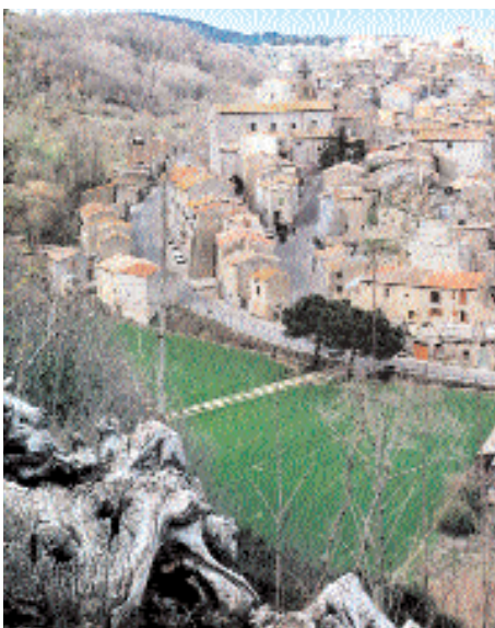
Il borgo di Piansano

cedute da curiosi pilastri figurati. Più avanti, in piazza Marconi, la chiesa Parrocchiale del '700, intitolata a San Bernardino , patrono del paese, con presbiterio a ponte su una via, è ampia e